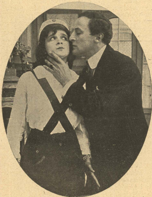
Tanken om Bedragerist.

Bøger, medens Else som sædvanlig ligger og driver. Ja, hun holder nok af at læse, men en hel anden Lektüre end den tørre Lærdom. Under Hovedpuden gemmer hun en dejlig Bog: „Kærlighedens Mysterium“, den vil hun læse, medens Agnete tager sit Tøj og gaar, bedrøvet over Elses sorgløse Dovenskab. Else skal imidlertid ikke faa Ro til at studere Kærlighedens Mysterium, for Postbudet kommer med et Brev til Agnete. Et Brev fra Amerika. Else er overrasket. Hun har aldrig anet, at Agnete, som ellers betror hende alt, har Bekendtskab i det fjerne Vesten. Hun