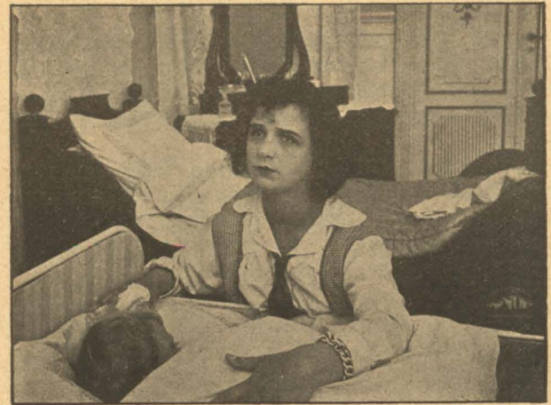
I fortvivlet Afsked med sit Barn.

Axel, da sker der noget, som med et Slag truer med at dræbe Lykken for dem. Axel har i en Avis fundet en Notits om, at den kvindelige Doktor phil. Agnete Bech er kommet til Amerika for at holde Foredrag, og Axel, som finder det besynderligt, at hun har samme Navn som hans Hustru, tilbyder Agnete Bech Ophold i sit Hjem.