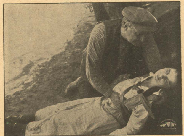
Ved Søens Bred.

Da saa Agnete staar for hende, falder hun